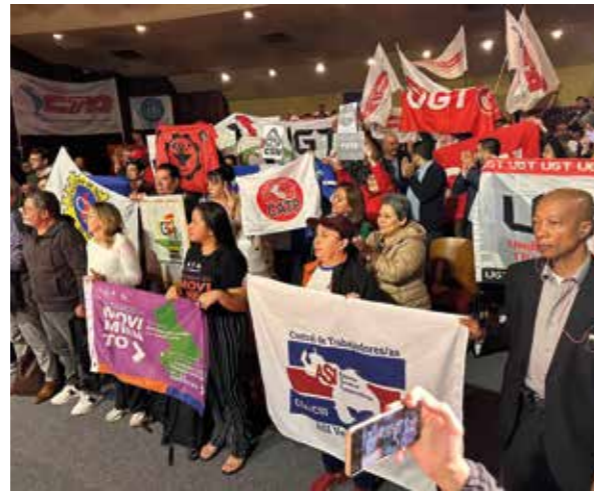
Delegaciones en la jornada