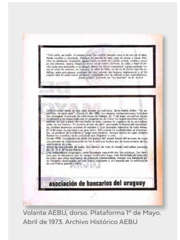
Volante AEBU, dorso. Plataforma 1º de Mayo. Abril de 1973. Archivo Histórico AEBU