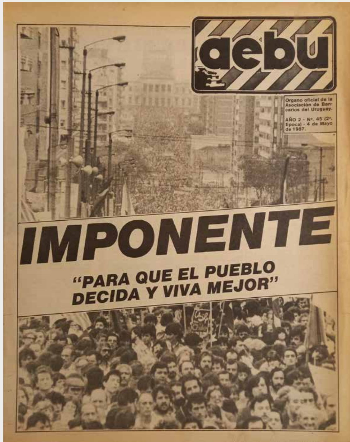
Portada Revista AEBU. Para que el pueblo decida mejor. 4 de mayo de 1987.

Muros y volantes nos convocan. Secuencias múltiples de fotos e hilos de historias audiovisuales en las redes y plataformas de internet, también nos recuerdan que el 1º de Mayo es el día de reunión concertada, de celebración de los trabajadores y trabajadoras.