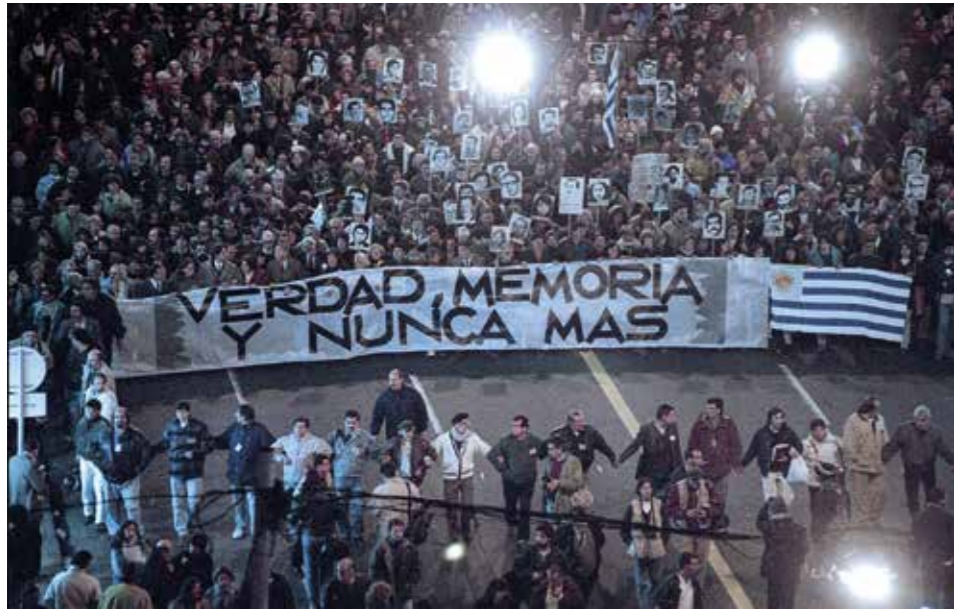
Primera Marcha del Silencio, el 20 de mayo de 1996.