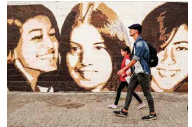
Mural en la calle Ramón Márquez a en el barrio Brazo Oriental de Montevideo.

En una breve intervención, Argimón relató los alcances de la sentencia de la CIDH, los derechos y la normativa que el Estado vulneró. También señaló las acciones que a nivel estatal se llevaron a cabo para su cumplimiento.