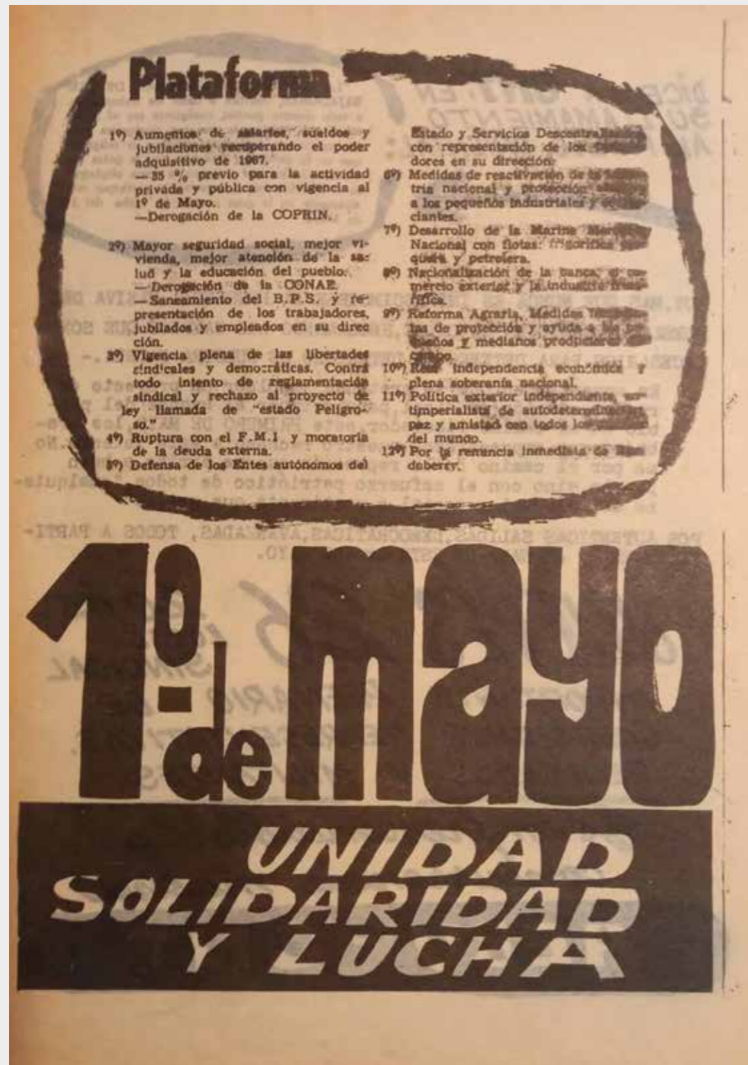
Volante AEBU, frente. 1º de mayo. Unidad, solidaridad y lucha. Mayo de 1972.