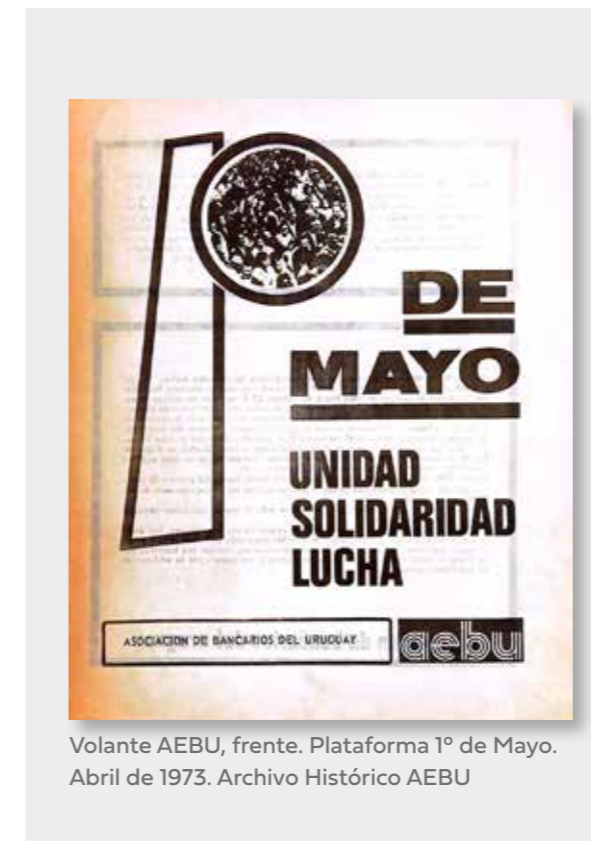
Volante AEBU, frente. Plataforma 1º de Mayo. Abril de 1973.

El grito colectivo que la barbarie quiso amordazar y que la vocación de libertad de los uruguayos supo mantener en la cárcel, en la clandestinidad, en el exilio y en cualquier circunstancia en la que solamente decir lo que se pensaba ponía en riesgo la vida, el trabajo, la seguridad personal, la de la familia, de los amigos, de los compañeros. Fueron muy valientes quienes los diseñaron, quienes los imprimieron, los reprodujeron, los distribuyeron, los guardaron. Y qué valentía gigantesca, que siempre nos enorgullece, la de aquellos pegatineros que sobre los muros multiplicaban consignas, a sabiendas de que el riesgo era enorme (Castillo, J. 2012. p. 15)